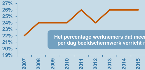
>6 uur per dag beeldschermwerk 4

Het percentage werknemers dat meer dan 6 uur per dag beeldschermwerk verricht neemt toe